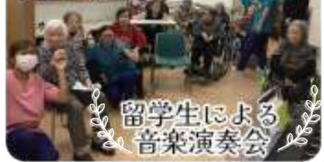
留学生による音楽演奏会