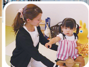
治療中は当院の保育士が、お子様たちのお相手をしっかりとさせていただきます。